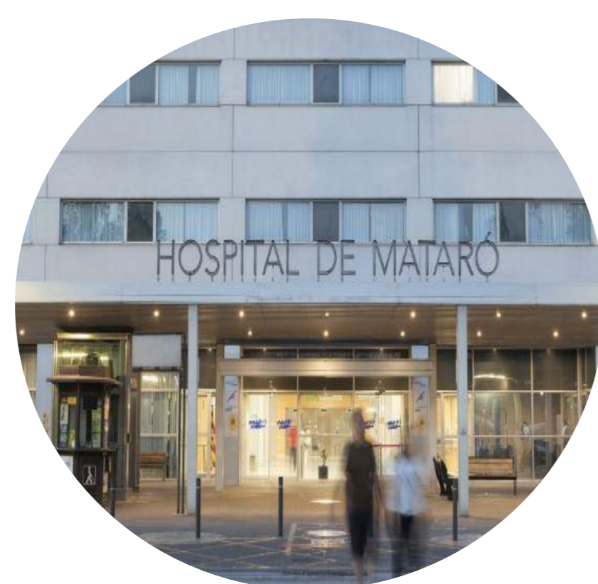
Hospital de Mataró